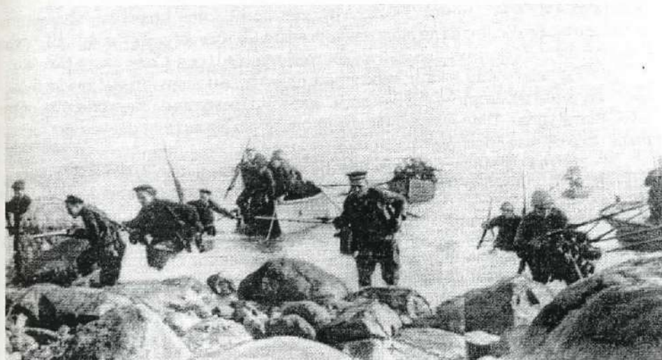
Высадка Тулоксинского десанта. 23 июня 1944 г.