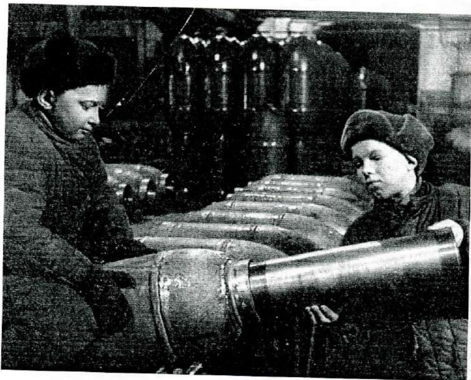
Работа подростков в цехе по изготовлению снарядов. 1942 г.

Начало Великой Отечественной войны потребовало от страны максимальной мобилизации всех ресурсов, в том числе трудовых. Это сказалось и на