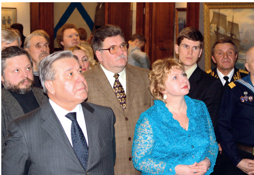
Открытие выставки «Сибирь и Российский флот. Шедевры Морского музея России». Слева направо: губернатор Омской области Л. К. Полежаев, П. П. Вибе, заместитель министра культуры Омской области А. Н. Гуменюк. 2006 г.