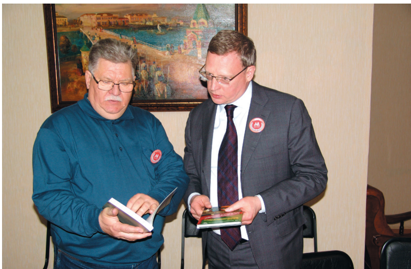
П. П. Вибе вручает свои книги губернатору Омской области А. Л. Буркову в дни празднования 140-летия музея. Май 2018 г.