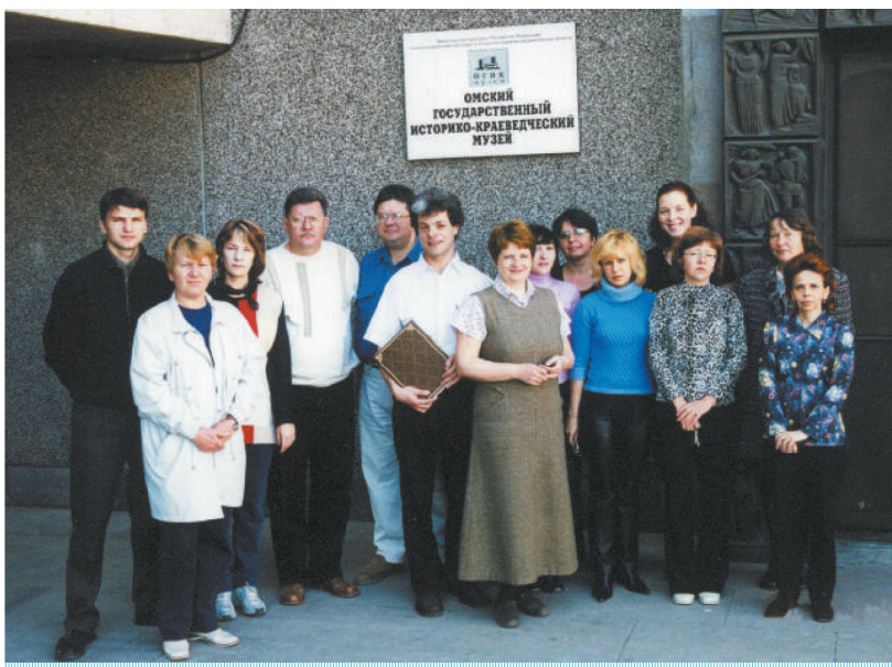
Представители ОАО Альт-Софт (Санкт-Петербург) и сотрудники ОГИК музея по окончании семинара по внедрению автоматизированной системы учета музейных предметов «КАМИС-2000». Май 2003 г.