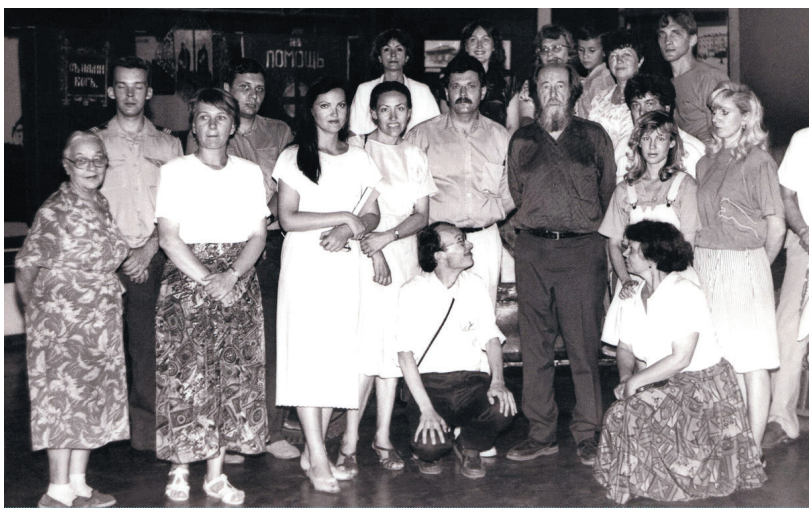
Сотрудники ОГИК музея с А. И. Солженицыным во время его визита в Омск. 4 июля 1994 г.