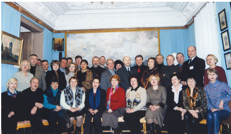
Участники заседания президиума Союза музеев России в Омске. 2003 г.