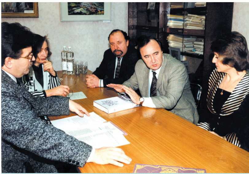
Мэр города Омска В. П. Роцупкин (в центре) в ОГИК музее. Обсуждение книги «Старый Омск». 2000 г.