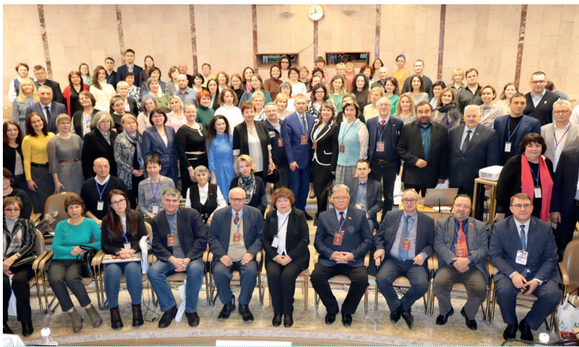
Общая фотография участников Всероссийского Омского краеведческого форума. Октябрь 2022 г.