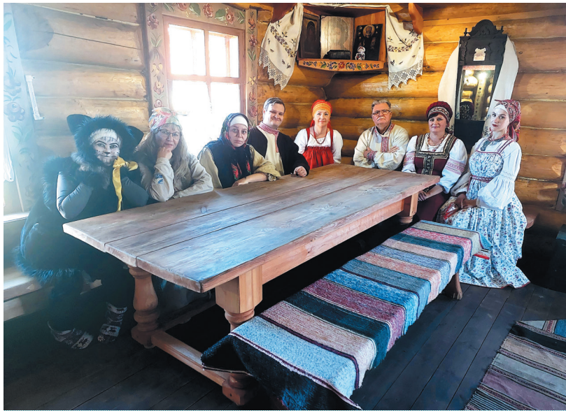
День рождения Этнопарка «Музей сказки "Васин хутор"». 2022 г.