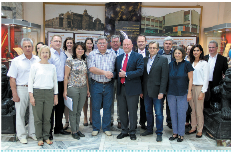
Участники Межправительственной Российско-Германской комиссии по вопросам российских немцев в ОГИК музее. 23 мая 2016 г.