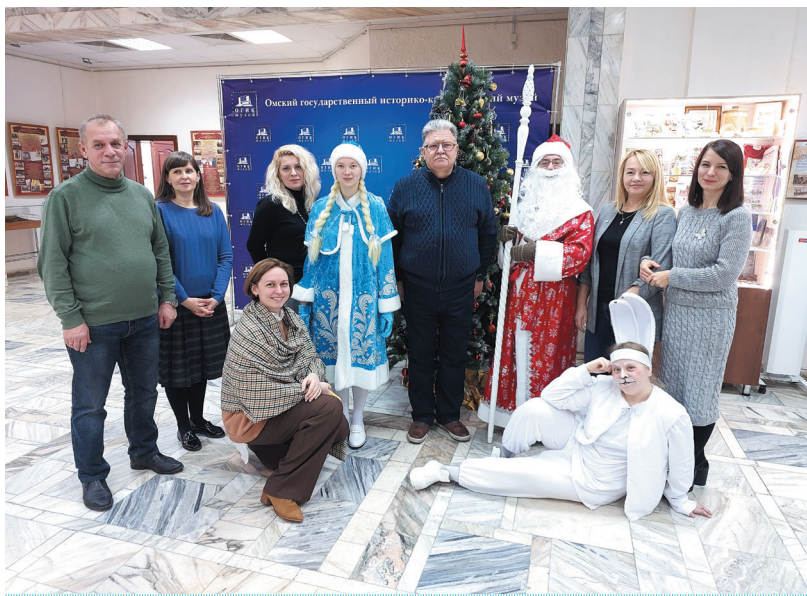
Новый год в ОГИК музее. Декабрь 2022 г.