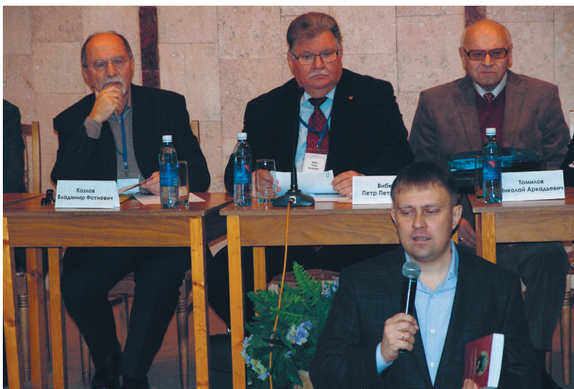
Выступление министра культуры Омской области Ю. В. Трофимова на пленарном заседании конференции «Четвертые Ядринцевские чтения». 2017 г.