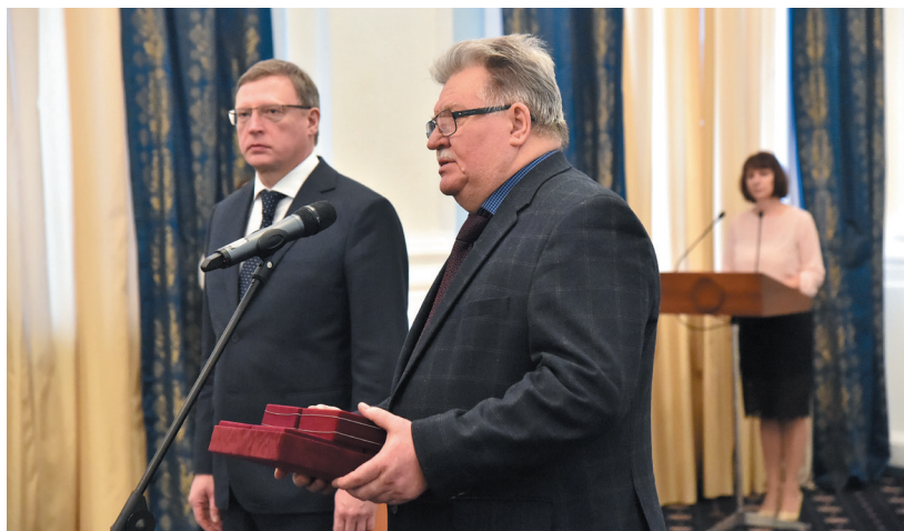
Губернатор Омской области А. Л. Бурков передает комплект наградных медалей времен 1941–1945 гг. в коллекцию ОГИК музея. 21 февраля 2020 г.