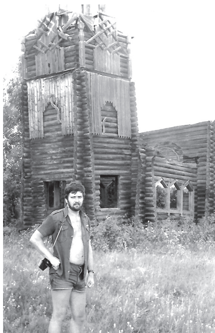
Обследование памятников культурной архитектуры. Омская область, Знаменский район, д. Липовка. Конец 1980-х гг.