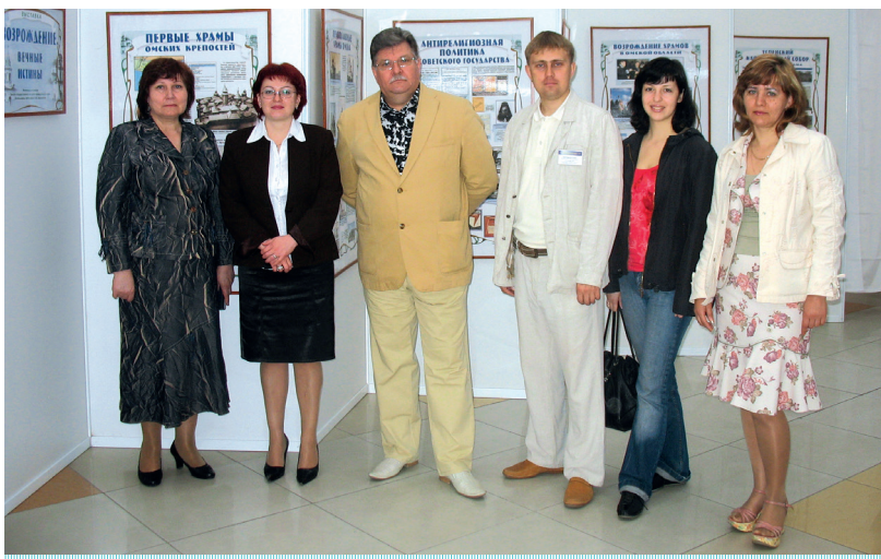
Сотрудники ОГИК музея на Первой международной православной выставке-ярмарке «На землю Сибирскую свет Троицы просиял» в выставочном комплексе «Континент-2». Июнь 2008 г.