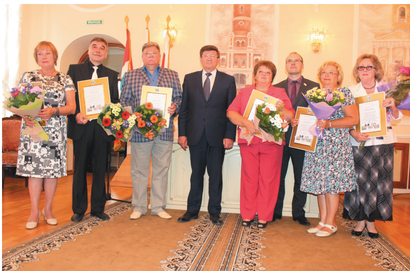
Омичи, имена которых включены в Книгу почета деятелей культуры города Омска 2015 г. В центре – мэр города Омска В. В. Двораковский. 2015 г.