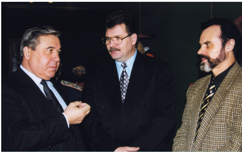
Губернатор Омской области Л. К. Полежаев, П. П. Вибе и заместитель губернатора Омской области А. И. Казанник на выставке «Возвращение сибирской святыни». 1999 г.