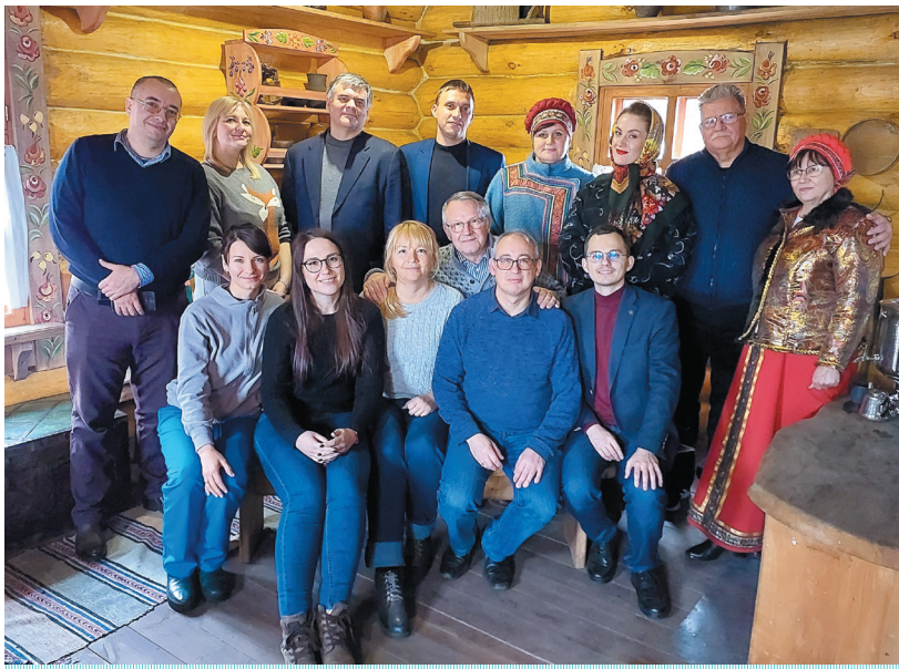
Участники Всероссийского Омского краеведческого форума в Этнопарке «Музей сказки "Васин хутор"». Октябрь 2022 г.