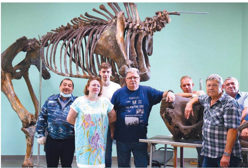
Участники монтажа скелета мамонта для новой экологической экспозиции. 26 августа 2021 г.